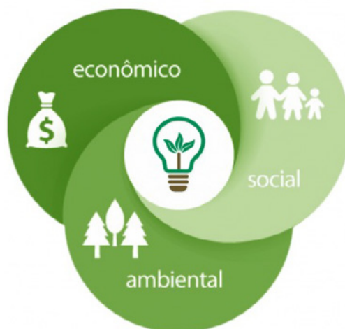
Figura 3 - Os três pilares do triple Bottom Line (TBL)

Considera-se que as organizações atuam de forma sustentável quando as suas ações têm em conta os três pilares do “Triple Bottom Line” (TBL), que reflete precisamente o carácter multidimensional da Sustentabilidade e refere-se a três dimensões interdependentes: económica, ambiental e social.