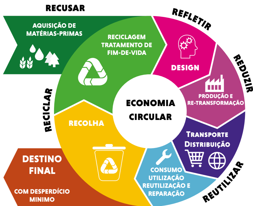
Figura 4 – Economia Circular

De acordo com o Ministério do Ambiente a “Economia Circular é um conceito estratégico que assenta na redução, reutilização, recuperação e reciclagem de materiais e energia”. Substituindo o conceito de fim-de-vida da economia linear, por novos fluxos circulares de reutilização, restauração e renovação, num processo integrado, a economia circular é vista como um elemento chave para promover a dissociação entre o crescimento económico e o aumento no consumo de recursos, relação até aqui vista como inexorável (Ministério do Ambiente, s.d.).