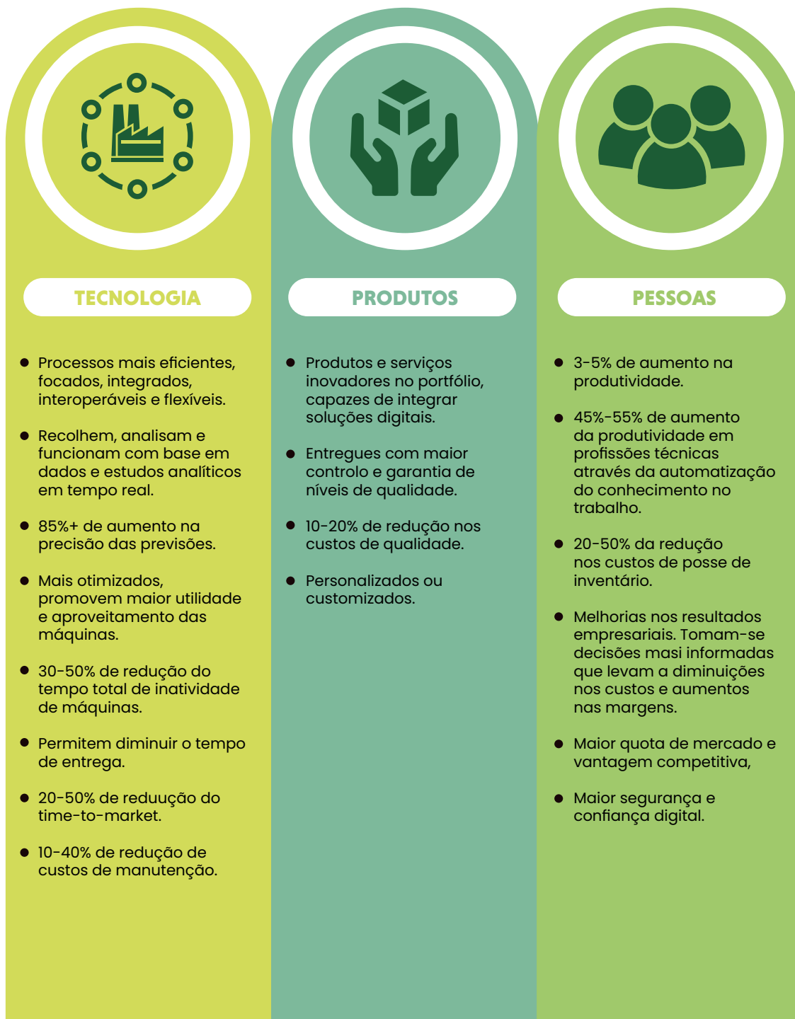
Figura 2 - Oportunidade de criação de valor na Indústria 4.0

Sustentabilidade das Empresas Familiares